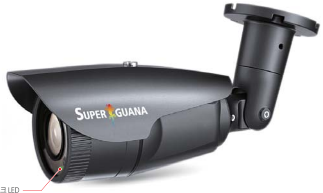
카메라 헬스 체크 LED